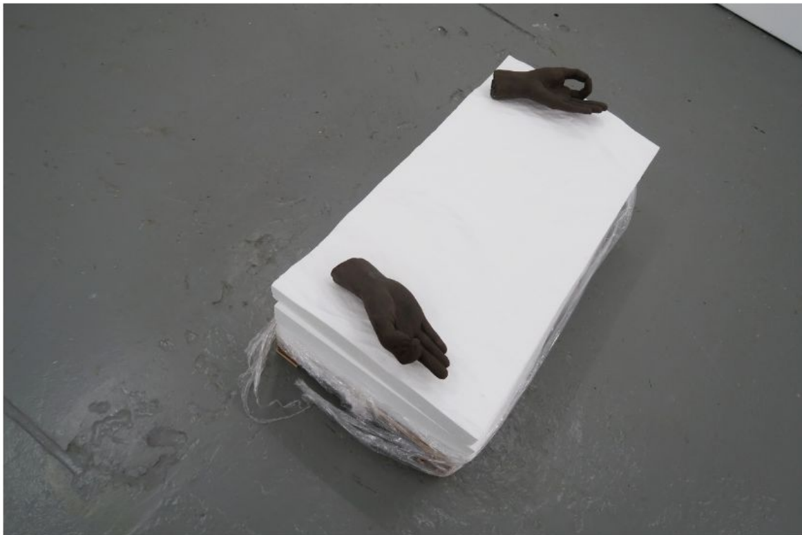
Jenny Lindblom, detail installatie, foto redactie