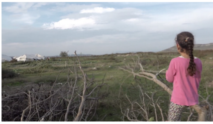
Lost in Translation