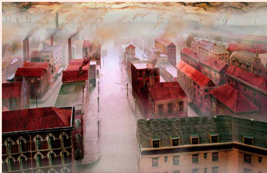
Jasper de Beijer, 'Smog', uit de serie 'The Riveted Kingdom' (2008).

'How Rest the Brave', t/m zondag 27 maart, donderdag en vrijdag 13.00-20.00 uur, zaterdag en zondag 12.00-18.00 uur, Nest, De Constant Rebecqueplein 20b. Meer informatie: www.nestruimte.nl