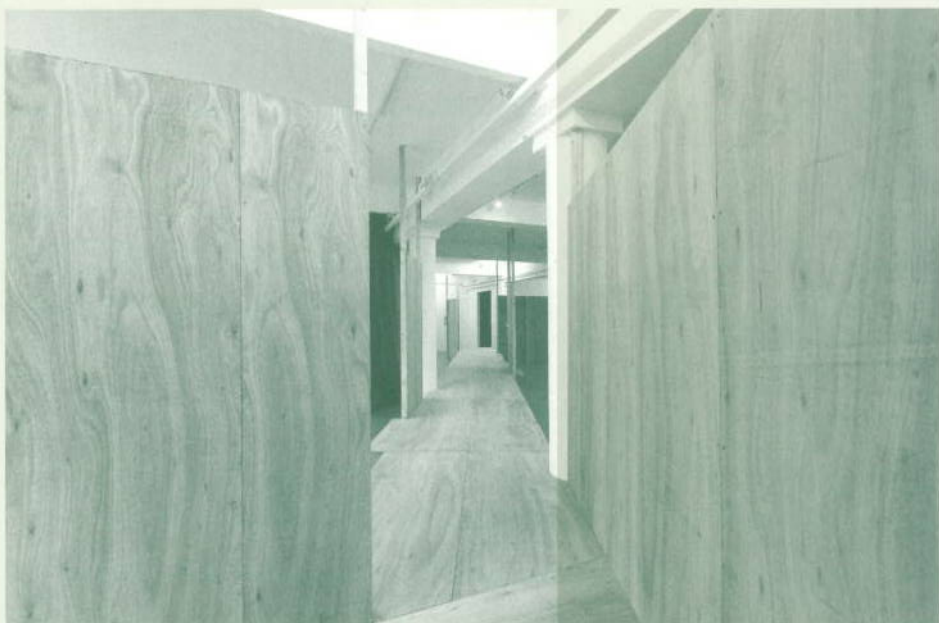
Remco Osório Lobato, The Last Temple , 2021, courtesy de kunstenaar en NEST, foto: Charlott Markus