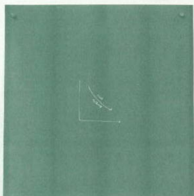
Yoojin Lee, Who falls asleep? (detail), 2016